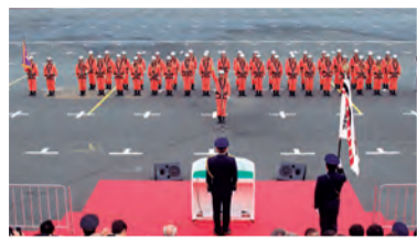
部隊員宣誓の様子

東京消防庁では、さらなる消火・救助・救急業務の高度化を目指し、航空消防救助機動部隊(エアハイパーレスキュー)を創設し、平成28年1月6日の東京消防出初式で発隊しました。航空消防救助機動部隊は、江東区と立川市に分散配備され、空中消火装置、大量救出用ゴンドラなど特殊な資器材を配備しています。また、陸上からでは対応困難な災害においても、ヘリコプターの機動力を最大限に活かし、迅速かつ効果的な消火・救助・救急活動を展開します。