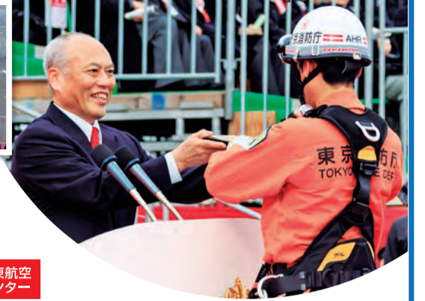
舛添東京都知事より記念品の贈呈