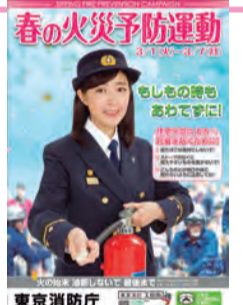
平成28年春の火災予防運動ポスター

都民の皆様に関心を持っていただくことにより、火災の発生を防ぎ、万が一発生した場合にも被害を最小限にとどめ、火災から尊い命と貴重な財産を守ることを目的としています。