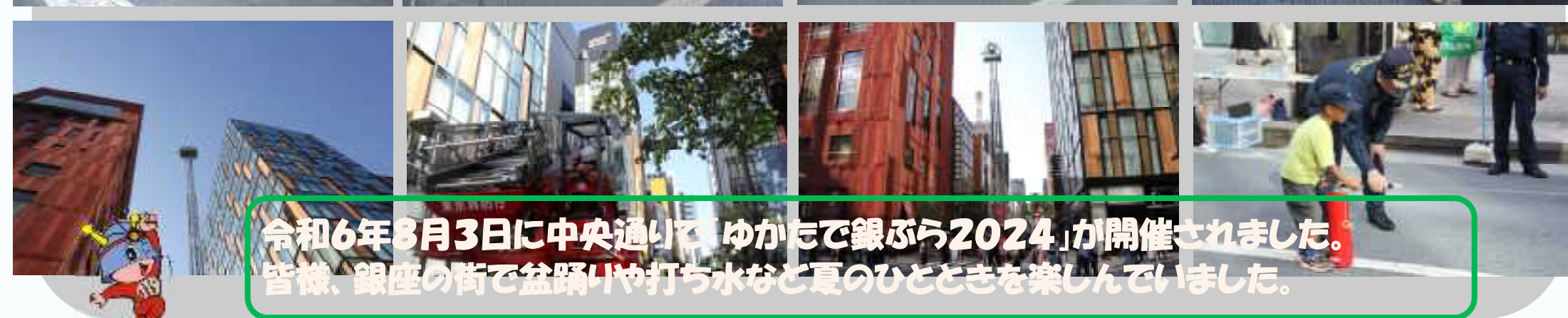
令和6年8月3日に中央通りで「ゆかたで銀ぶら2024」が開催されました。皆様、銀座の街で盆踊りや打ち水など夏のひとときを楽しんでいました。