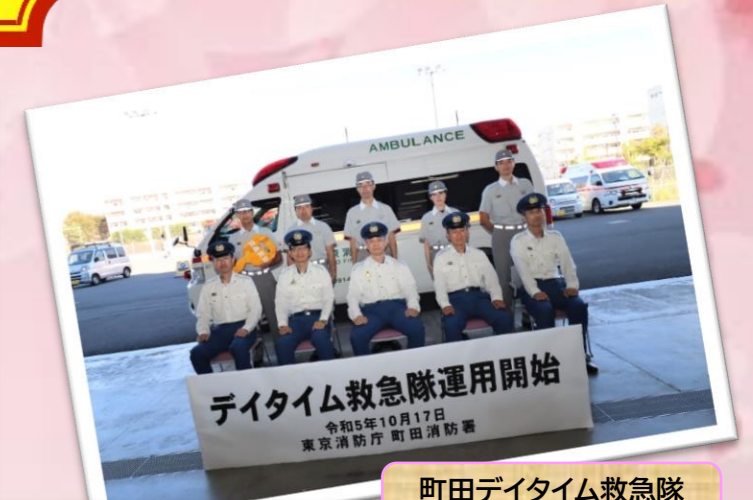
デイトム救急隊運用開始 令和5年10月17日 東京消防庁 町田消防署