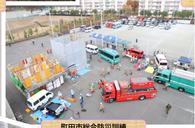
町田市総合防災訓練 ～各防災機関と連携訓練～