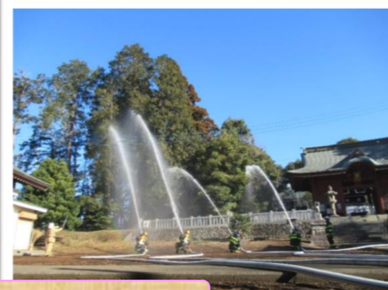
文化財防火デー消防演習