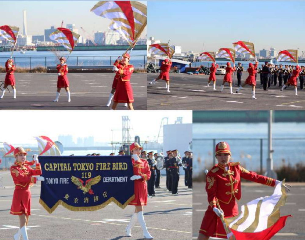
12/25【東京消防出初式 予行】