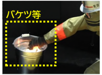
多量の水に沈め、消えたら器具を取り出す!