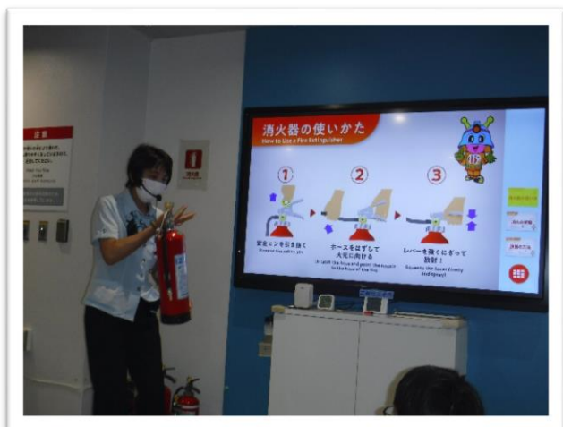
消火器の使い方を防災館職員から教わります