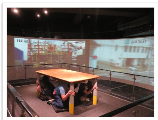
震度7の揺れを体験