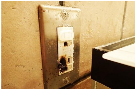
壁付きコンセント焼損状況