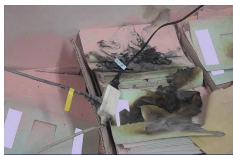
テーブルトップの焼損状況