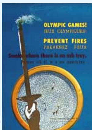
1964年当時の外国人向け火災予防ポスター

当時の東京消防庁は、競技場の警戒や会場管理など、災害の未然防止に対する取組の他にも、おもてなしの精神から、背丈の高い外国人のために屈折型の担架を準備したり、消防職員に対して英会話研修を実施しました。また、大会の公用語であるフランス語と英語で「タバコは灰皿のあるところで吸いましょう」と呼びかける外国人向け火災予防ポスター(左図)も作成しました。