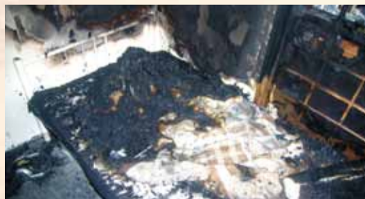
【ベッドの布団が燃えた様子】

一人暮らしの居住者が飲酒した後、ベッドの上で喫煙し、その際にたばこの火種が布団に落下したことに気付かず就寝してしまい、その後出火しました。 住宅用火災警報器は設置されていませんでした。