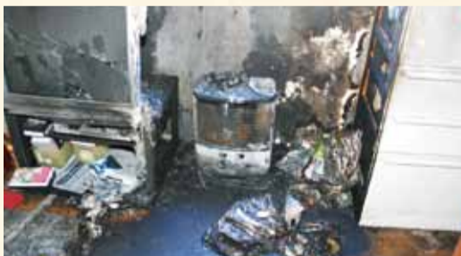
【ストーブの上の洗濯物が燃えた様子】

洗濯物を室内で乾かすために、石油ストーブ上方のカーテンレールに洗濯ハンガーを吊るしていました。 その後洗濯ハンガーの洗濯物が、石油ストーブに落下し出火しました。