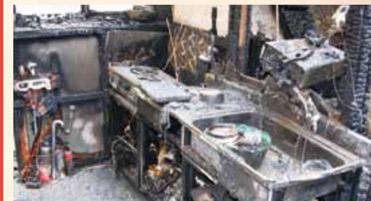
【ガスコンロ周辺の様子】

油を入れたフライパンをガスコンロにかけ、点火したままその場を離れたため出火しました。 火災に気がつき炎が立ち上がっているフライパンに水をかけたところ、炎が急激に拡大しました。