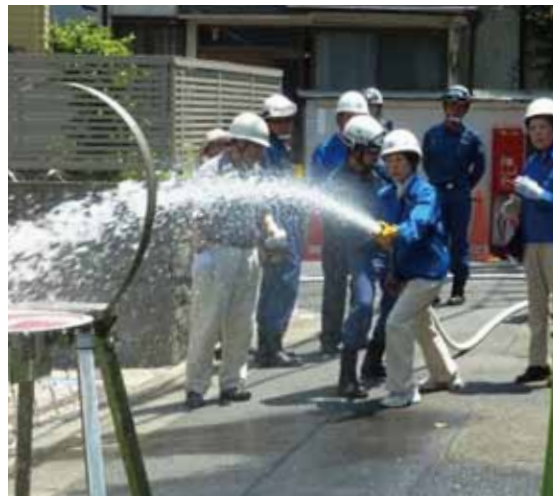
まちかど防災訓練の様子