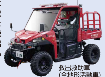
救出救助車 (全地形活動車)

近年頻発する広域自然災害において、特殊車両やエアポートによる泥濘地や浸水地域等への進入、ドローン等による災害状況の確認・把握を行うとともに、他隊と連携した迅速な救出活動を任務とする新しい部隊です。