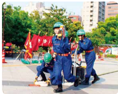
多数の方が集まるイベントなどの警戒を行います