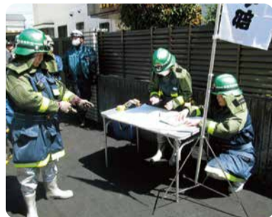
災害現場での情報収集や住民の避難誘導を行います