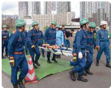
災害現場での活動を想定した訓練を行います