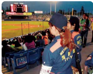
多数の方が集まるイベントなどの警戒を行います