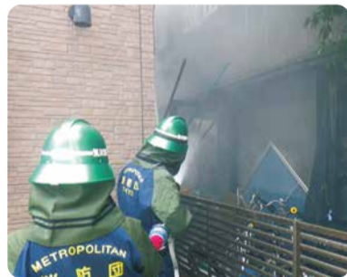
火災発生時は、自宅や職場から現場に駆けつけて消火活動を行います