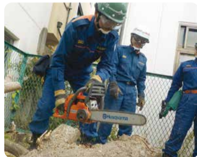
消防署と連携し、地震や台風などの大規模災害に対応します