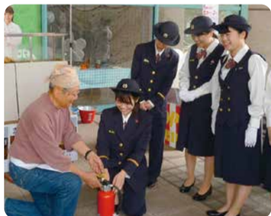
地域の方へ消火器の使い方などの指導を行います