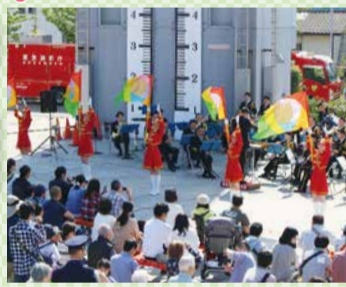
過去の一般公開の様子

https://www.tfd.metro.tokyo.lg.jp/hp-gijyutuka/index.html