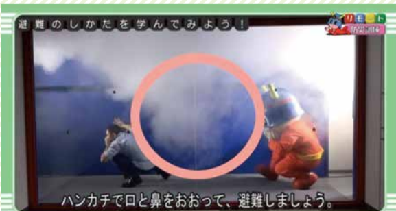
リモート防災訓練:キュータと学ぼう! 避難のしかた