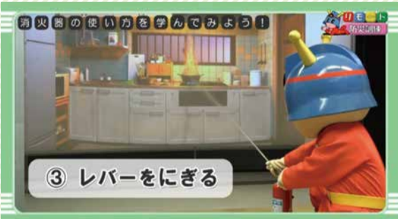
リモート防災訓練:キュータと学ぼう! 消火器の使い方

消火器の使い方、避難のしかたなどを分かりやすく説明しています。防災訓練の予習・復習に活用してください。