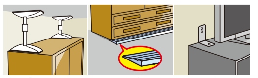
ポール式 ストッパー式 L型金具