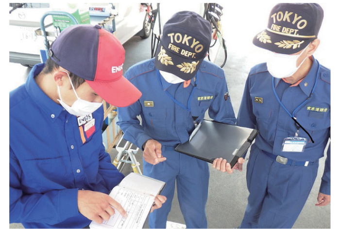
▲ガソリンスタンドの従業員にガソリン販売時の本人確認等の必要性を指導