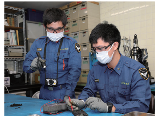
▲電気火災の原因調査

近年、電気製品を原因とする火災が増えており、全火災件数のおよそ3割を占めています。東京消防庁では「小さなこげ跡」も火災として扱い、原因を調べて火災予防につなげています。