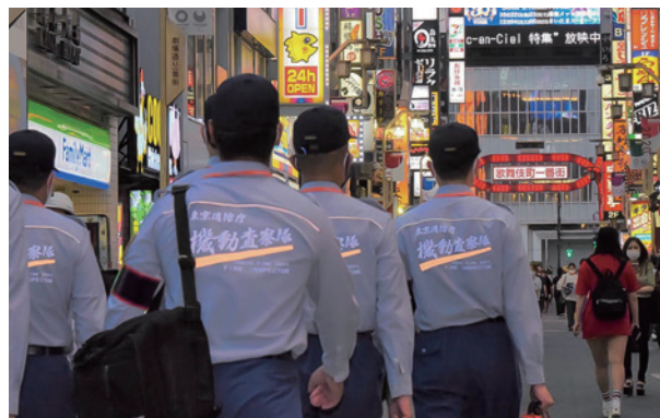
▲歌舞伎町の夜間査察に向かう機動査察隊

繁華街地域はテナントの入れ替わりが激しく、消防法令違反を繰り返す小規模雑居ビルなどが多数存在します。このことから、繁華街地域の防火安全の充実を図るため、積極的な立入検査を実施し、違反是正指導を強化しています。新宿歌舞伎町地域では、新宿消防署に24時間駐在する「機動査察隊」を配置しています。