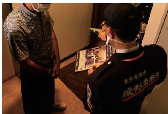
▲ビルの関係者に機動査察隊が避難経路に物を置かないよう指導している様子