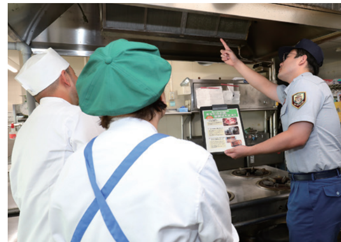
▲飲食店の従業員にダクト汚れの危険性を指導