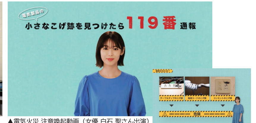
▲電気火災 注意喚起動画 (女優 白石 聖さん出演)