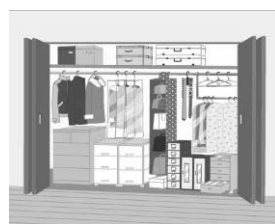
クローゼットへの集中収納