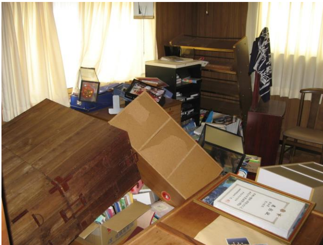
(平成19年新潟県中越沖地震)