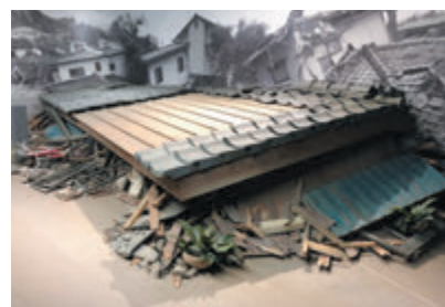
▲ リアルな造形での体験

また、現場活動における二次災害の危険性や要救助者の捜索、救出要領等について体験学習できます。