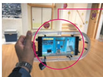
▲ ARタブレット画面イメージ