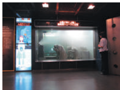
▲ 暴風雨体験コーナー体験の様子

また、画面上部には体験室内の「雨量」「風速」が表示されるため、体験室内の状況がより理解しやすくなっています。