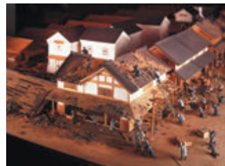
▲ 江戸時代の消火風景