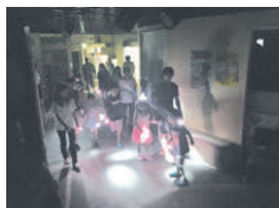
▲ ナイトツアー体験の様子