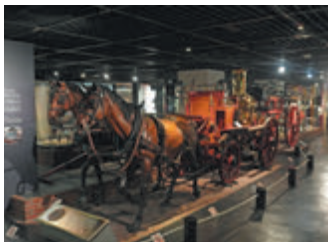
▲ 馬牽き蒸気ポンプ