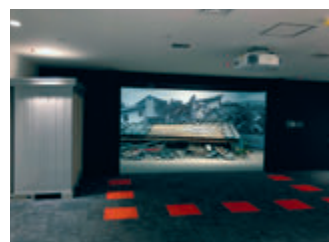
▲ 映像が終ると目の前に倒壊家屋が現れる▲