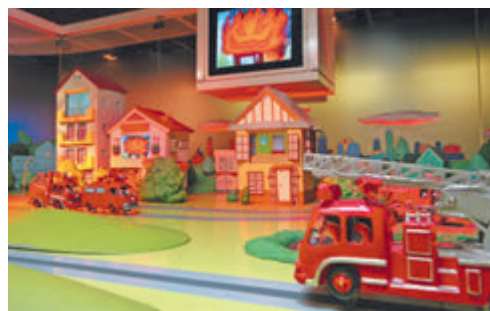
▲ ショーステージ (消防活動のしくみ)