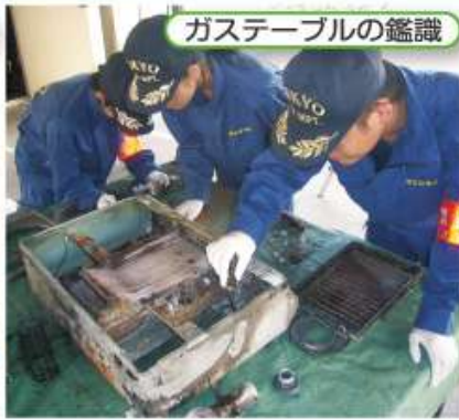
ガステーブルの鑑識

火災が発生すると、消火や救助を行う一方で、火災の原因を科学的に究明しています。調査の結果は、出火防止の広報などを通じて同じような火災の防止に役立てています。