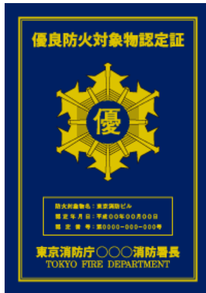
優良防火対象物認定証（通称：優マーク）