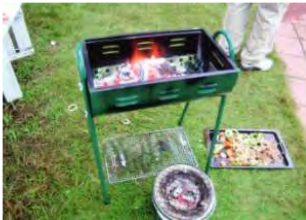
写真 2 - 1 使用したこんろの状況