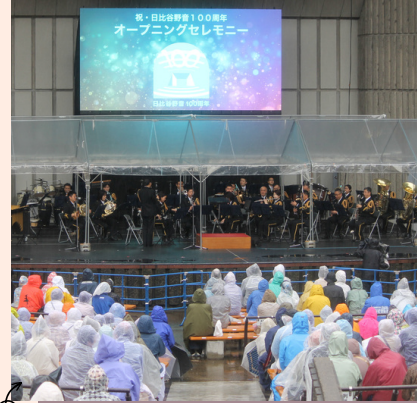
4/15【日比谷野音】客席は傘NGのため、 お客さんはみんな雨ガッパでした。