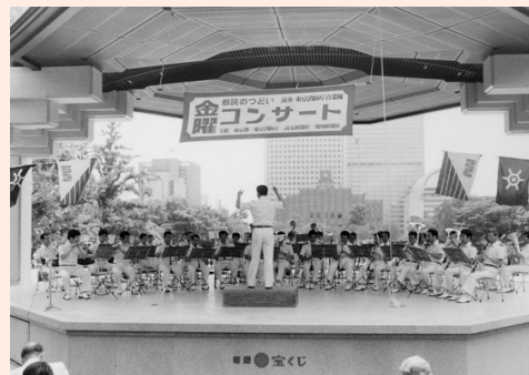
昭和58年7月1日 第403回金曜コンサート

開場は11:30、開演は12:00ですが、10:30を過ぎるとお客さんは続々と集まり始め、リハーサルでも会場の外からご丁寧に拍手をさせていただきます。そんな余談からも金曜コンサートがファンの多い演奏会であることがお分かりいただけるかと思います。