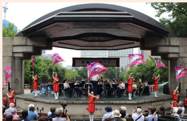
カラーガーズ隊も大活躍。

金曜コンサートのオープニングは、必ず「行進曲『東京都』」を演奏します。この時間はまだ雨が少し降っていましたが、たくさんの方にご来場頂きました。