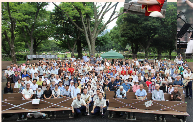
最後は、客席のお客さんと一緒に記念撮影しました。