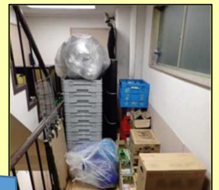
2回目の立入検査で 確認した違反の状況