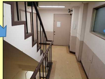
消防職員による 是正指導後の状況