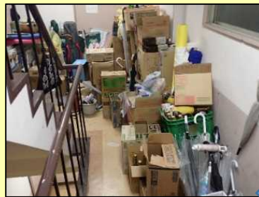
1回目の立入検査で 確認した違反の状況