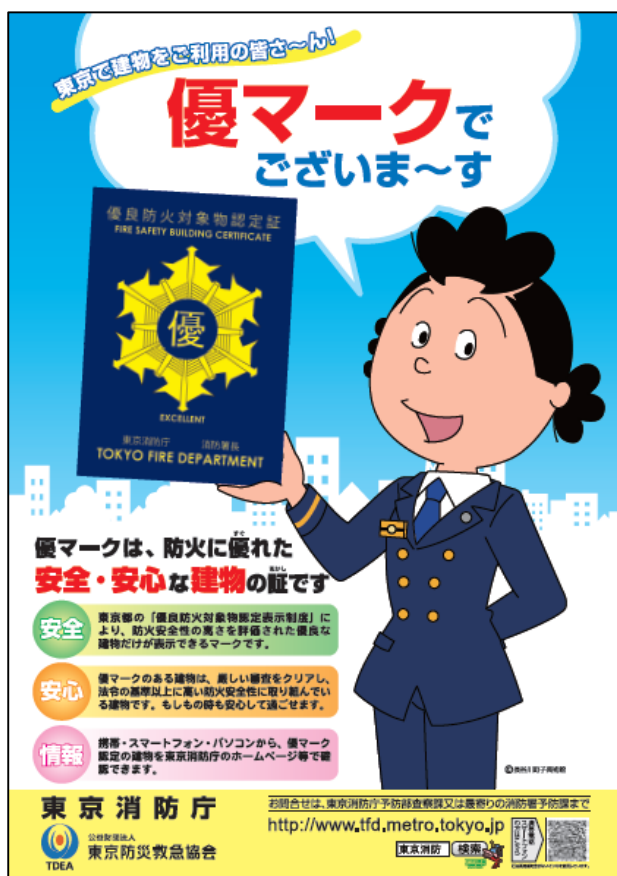
【優良防火対象物認定表示制度】 (優マーク制度)