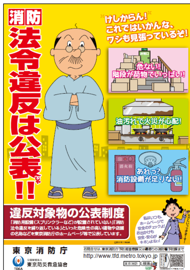
【違反对象物の公表制度】