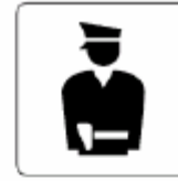
警察 Police 경찰 警察