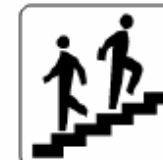
階段 Stairs 계단 台阶