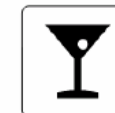
バー Bar 바 酒吧