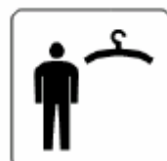
更衣室 Dressing room 탈의실 更衣室