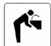
水飲み場 Water fountain 음료수 대 饮水处