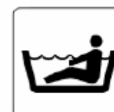
浴室 Bath 욕실 浴室