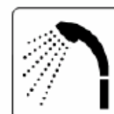
シャワー Shower 샤워 淋浴