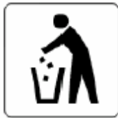
くず入れ Trash box 휴지통 垃圾箱