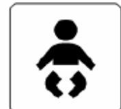
乳幼児用設備 Nursery 유아용설비 乳幼児用设备