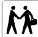
ミーティング ポイント Meeting point 미팅 포인트 会议点