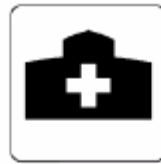
病院 Hospital 병원 医院