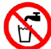
飲めない Not drinking water 마실수 없음 不能饮用