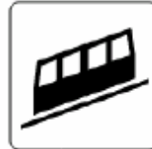
ケーブル鉄道 Cable railway 케이블 철도 缆车