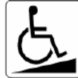
車椅子スロープ Accessible slope 휠체어용 슬로프 轮椅专用道