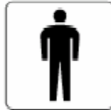
男子 Men 남자 男子