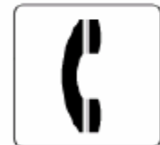
電話 Telephone 전화 电话