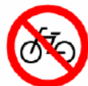
自転車乗り入れ禁止 No bicycles 자전거 진입금지 自行车禁止入内 ※3