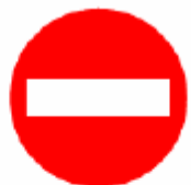
進入禁止 No entry 진입금지 禁止进入 ※3