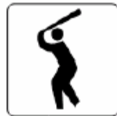
野球場 Baseball stadium 야구장 棒球场