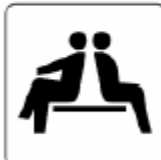
休憩所 / 待合室 Lounge / Waiting room 휴게실 / 대기실 休息所 / 等候室