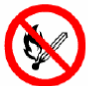
火気厳禁 No open flame 화기엄금 严禁烟火