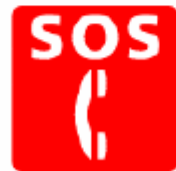
非常電話 Emergency telephone 비상전화 求救电话