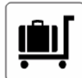
カート Cart 카터 手推车