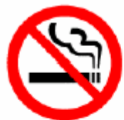
禁煙 No smoking 금연 禁烟 ※4