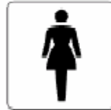
女子 Women 여자 女子