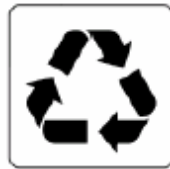
リサイクル品回収施設 Collection facility for the recycling products 리사이클용품 회수시설 废品回收站