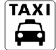
タクシー／タクシ- のりば Taxi / Taxi stop 택시 / 택시승강장 的士 / 出租车站