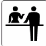
チェックイン / 受付 Check-in / Reception 체크인 / 접수 服务台