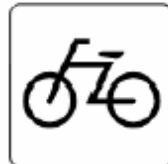
自転車 Bicycle 자전거 自行车