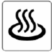
温泉 Hot spring 온천 温泉