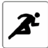
陸上競技場 Athletic stadium 육상경기장 田径赛场