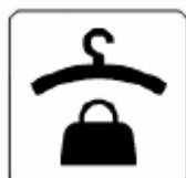
クローク Cloakroom 클럭 衣帽室