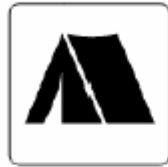
キャンプ場 Camp site 야영장 野营场