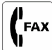
ファックス Fax 팩스 传真