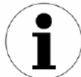
情報コーナー Information 인포메이션 센터 信息中心