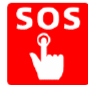
非常ボタン Emergency call button 비상벨 求救按钮