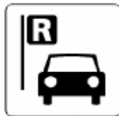
レンタカー Rent a car 렌트 카 出租车