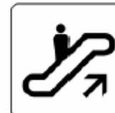
エスカレーター Escalator 에스카레이터 自动扶梯