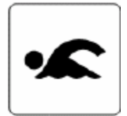
海水浴場／プール Swimming place 레수욕장／플장 海水浴场／游泳池