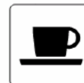
喫茶・軽食 Coffee shop 차 · 스낵 咖啡 / 便饭