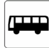
バス／バスのりば Bus / Bus stop 버스 / 버스정류장 公共汽车 / 公共汽车站