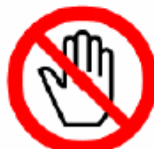
さわるな Do not touch 만지지 마세요 不许触摸