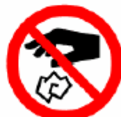
捨てるな Do not throw rubbish 버리지 마세요 不许乱丢垃圾