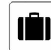
手荷物受取所 Baggage claim 수하물 수령소 行李领取处