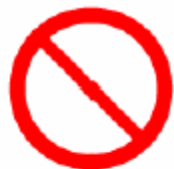
一般禁止 General prohibition 일단금지 禁止 ※3