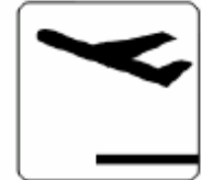
出発 Departures 출발 出发