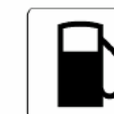
ガソリンスタンド Gasoline station 주유소 加油站