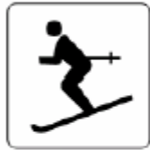
スキー場 Ski ground 스키장 滑雪场