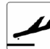
到着 Arrivals 도착 到达