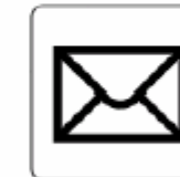
郵便 Post 우편 邮政