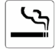
喫煙所 Smoking area 흡연소 吸烟角 ※1