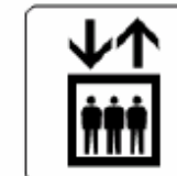
エレベーター Elevator 엘레베이터 电梯