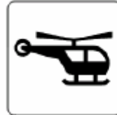
ヘリコプター／ ヘリポート Helicopter / Heliport 헬리콥터 / 헬기장 直升飞机 / 直升飞机场