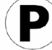
駐車場 Parking 주차장 停车场 ※3