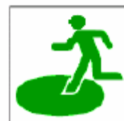
広域避難場所 Safety evacuation area 대피소 广域避难所