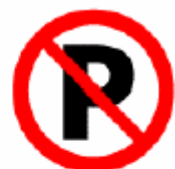
駐車禁止 No parking 주차금지 禁止停车 ※3