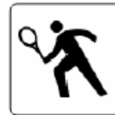
テニスコート Tennis court 테니스 코트 网球场