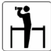
展望地／景勝地 View point 전망대／경승지 了望台／名胜地