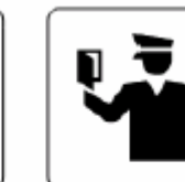
出国手続／入国手続／ 検疫／書類審査 Immigration / Quarantine / Inspection 출국수속 / 입국수속 / 검역 / 서류심사 出国手续 / 入境手续 / 检疫 / 文件审查