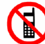
携帯電話使用禁止 Do not use mobile phones 휴대전화사용금지 禁止使用手机