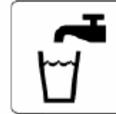
飲料水 Drinking water 음료수 饮用水