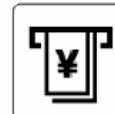
キャッシュサービス Cash service 현금인출 서비스 取款机 ※2