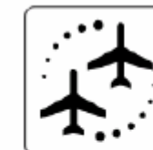
乗り継ぎ Connecting flights 갈아타기 接着乘坐