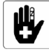
救護所 First aid 응급실 救护所