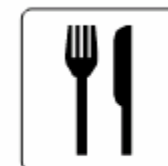
レストラン Restaurant 레스토랑 餐馆