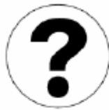
案内所 Question & answer 안내소 问讯处