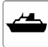
船舶／フェリー／港 Ship / Ferry / Port 선박 / 페리 / 항구 船舶 / 渡口 / 港