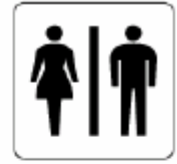
お手洗 Toilets 화장실 洗手间