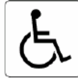
身障者用設備 Accessible facility 장애자용 설비 轮椅人士用洗手间