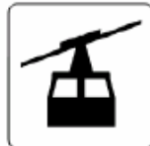
ロープウェイ Cable car 케이블카 空中缆车