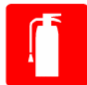
消火器 Fire extinguisher 소화기 消防容器