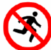
走るな／かけ込み禁止 Do not rush 뛰지마세요／ 뛰어들기 금지 不得奔跑／推挤