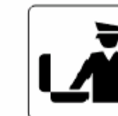
税関／荷物検査 Customs / Baggage check 세관 / 수하물검사 海关 / 行李检查