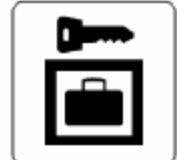
コインロッカー Coin lockers 코인 락카 投币式自动 存放柜