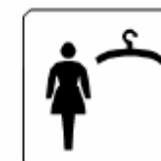
更衣室(女子) Dressing room (women) 탈의실(여자) 更衣室(女子)