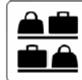
手荷物一時預かり所 Baggage storage 수화물 일시 보관소 手提行李一小时 寄存处