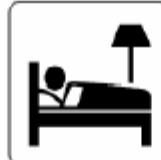
ホテル / 宿泊施設 Hotel / Accommodation 호텔 / 숙박시설 酒店 / 宿泊设施