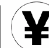
会計 Cashier 계산대 收银处 ※2