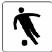
サッカー競技場 Football stadium 축구경기장 足球场