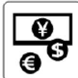
銀行・両替 Bank, money exchange 은행·환전 银行·兑换