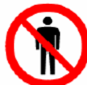
立入禁止 No admittance 진입금지 不得进入