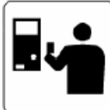
きっぷうりば / 精算所 Tickets / Fare adjustment 티켓판매소 / 정산소 售票口 / 补票清算处