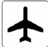
航空機／空港 Aircraft / Airport 항공기 / 공항 飞机 / 机场