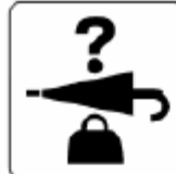
忘れ物取扱所 Lost and found 분실물 취급소 遺失物品寄存处