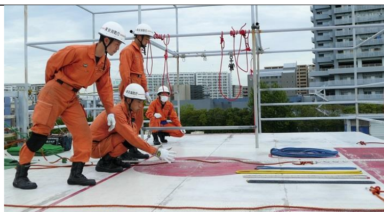
ロープブリッジ救出