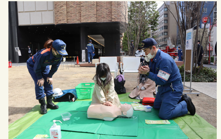
令和5年春の火災予防運動 KANDA SQUARE(千代田区神田錦町2-2-1)行われた防災体験フェア