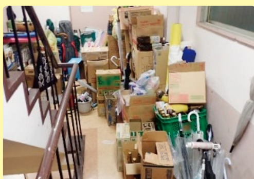
防火戸や防火シャッターの前に物が置かれていませんか？