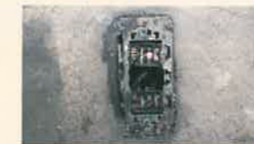
壁付コンセントの発火