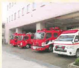
朝日出張所 府中市朝日町3-13 (042)363-0119