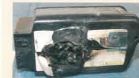
自転車用リチウムイオンバッテリーの発火