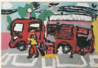
第72回はたらく消防の写生会優秀作品