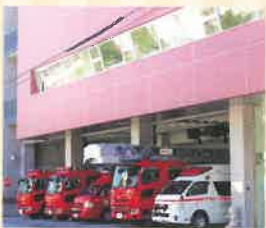
府中消防署 府中市寿町1-5 (042)366-0119