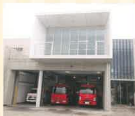
分梅出張所 府中市分梅町5-9-7 (042)368-0119