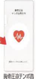
胸骨圧迫テンポ音