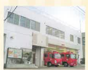
栄町出張所 府中市栄町3-1-4 (042)364-0119