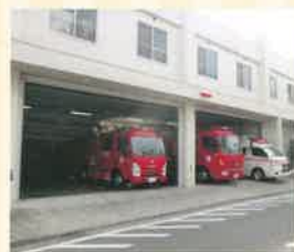
是政出張所 府中市是政2-12-5 (042)365-0119