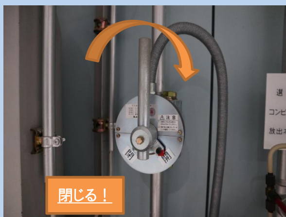
集合管に設置された 閉止弁の閉止例