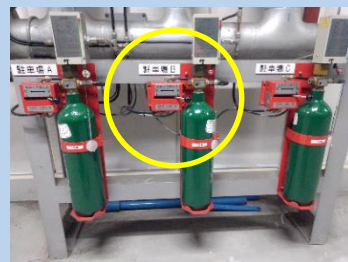
操作管に閉止弁を設置した例