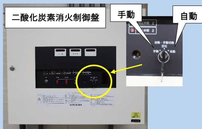
制御盤に設置された 自動手動起動切り替えの例