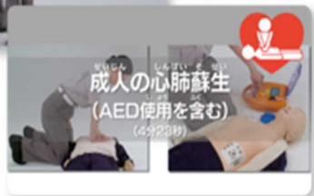
救急サポート動画