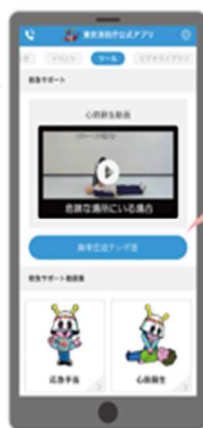
胸骨圧迫テンポ音