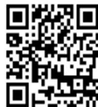
ダウンロードはこちら