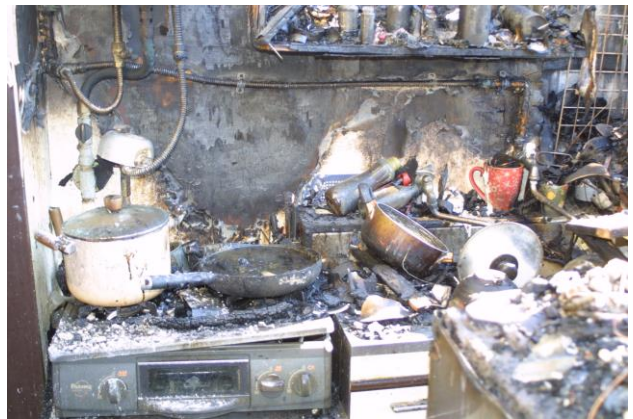
ガステーブルを使用中に外出したため、火災に発展した事例