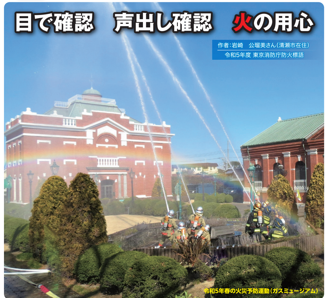
令和5年春の火災予防運動(ガスミュージアム)