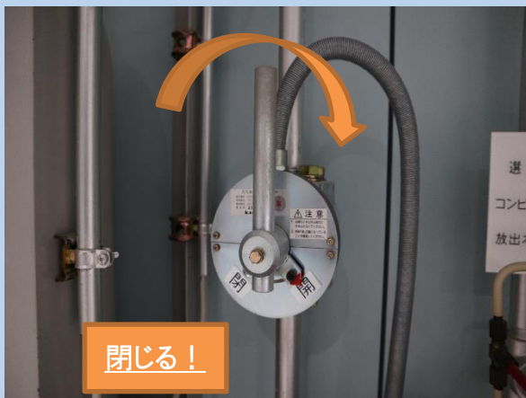
集合管に設置された 閉止弁の閉止例