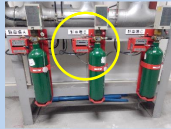
操作管に閉止弁を設置した例