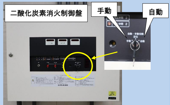
制御盤に設置された 自動手動起動切り替えの例