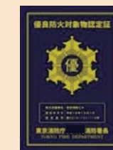
これまでのデザイン