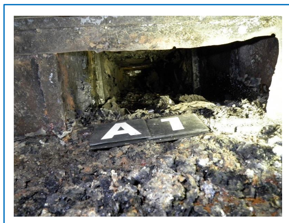
焼損したダクトの内部